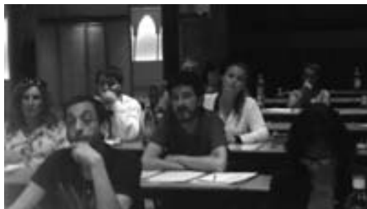
Sesiones de trabajo

sido víctimas». Así, ha defendido que la unificación de fuerzas es «un importante paso adelante».