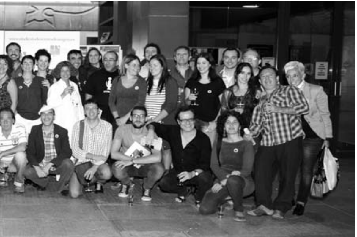
Actores y Actrices de SAAA