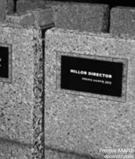
Premios AAAPIB deconstruidos