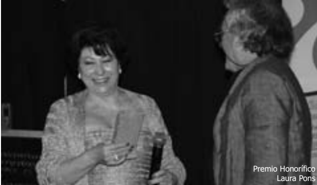
Premio Honorífico Laura Pons